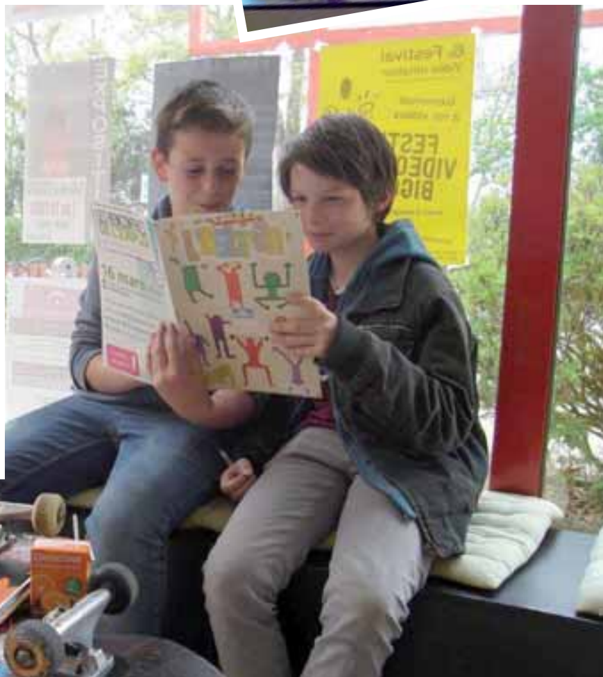
A la découverte de votre revue entre les figures de skate