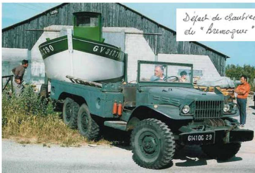
Départ du chantier pour le lancement du « Bremaquer »