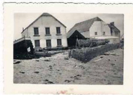
Café des flots et Chantier Marcel CARIBER au plan d'eau