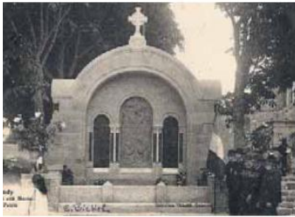
Inauguration du monument aux morts en 1924 en présence des anciens combattants de 1870

Loctudy fournit aussi des engagés désireux de servir sur les mers et dans l'Empire (il existait à Brest un régiment d'infanterie coloniale). La proportion des Bretons dans la Marine Nationale était très forte : ainsi en 1932, sur un effectif total de 59 000 hommes, 27 000 provenaient de notre province.