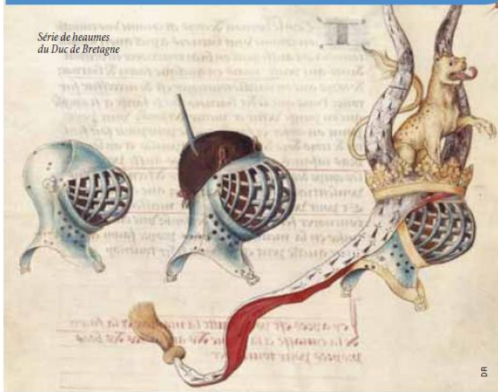
Série de heaumes du Duc de Bretagne