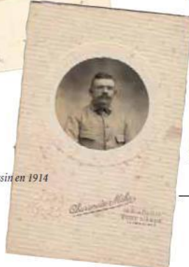
Un fantassin en 1914