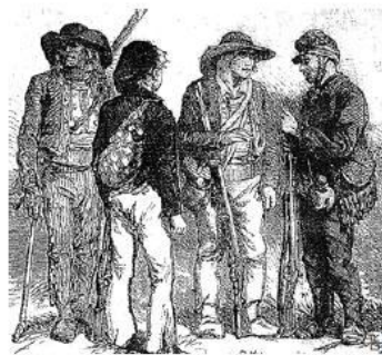
Mobiles bretons en 1870

(Fin du Second Empire, Troisième République)