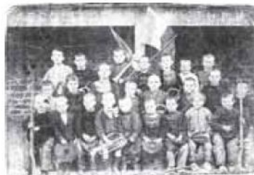
Soldats «en herbe» à l'école des garçons du Bourg vers 1900

Deux associations qui comportaient des sections à Loctudy furent créées pour défendre leurs droits et remplir le devoir de mémoire, notamment lors de la commémoration de l'armistice du 11 novembre. Ce sont l'Union Nationale des Combattants et l'Union Bretonne des Combattants.