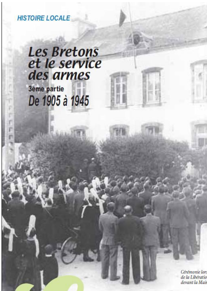
Cérémonie lors de la Libération en août 1944 devant la Mairie-Ecole