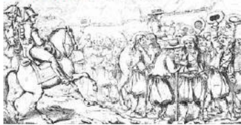
Le départ des conscrits

(Monarchies Constitutionnelles de Louis XVIII et Louis-Philippe, Seconde République, Second Empire)