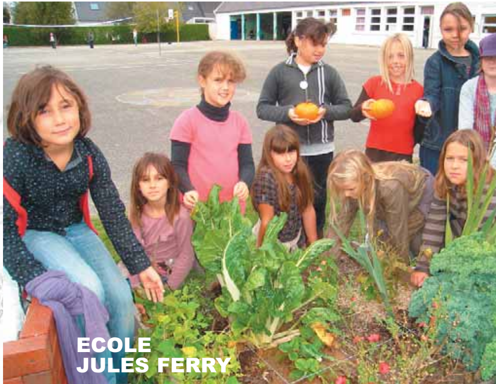
ECOLE JULES FERRY