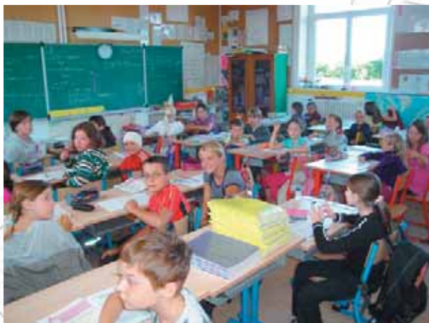
Une classe de l'école de Larvor

Sylvie Le Pape : Elle sera en tout cas bien remplie et finalement passera trop vite