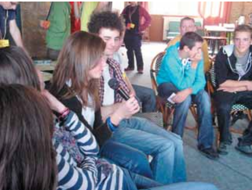
Une commission de travail