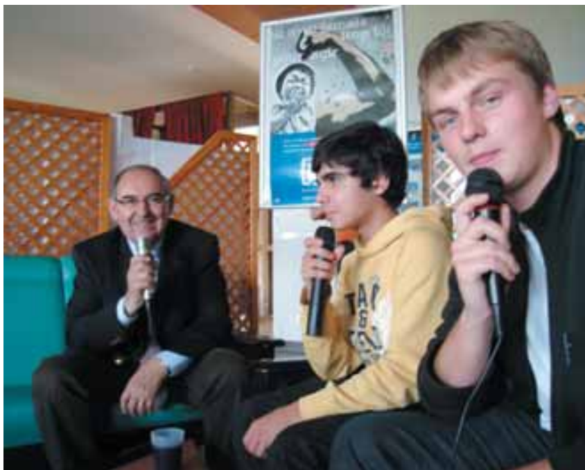
Les animateurs de «New Wave Radio» en pleine séance

Chaque membre doit bien entendu donner son accord pour participer à l'association. Si des majeurs souhaitent vous rejoindre, ils ne doivent pas être plus de 50% des membres et ne pourront pas représenter la