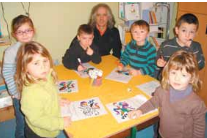
Une langue bien vivante