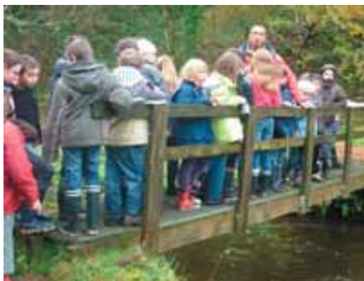
A la source de la rivière de Pont-l'Abbé