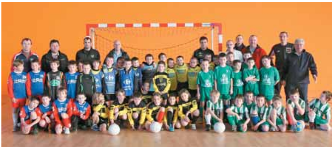
Les équipes de futsal