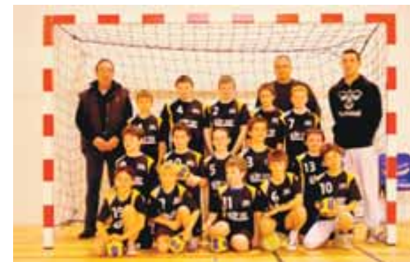
Handball, équipe des 12 ans