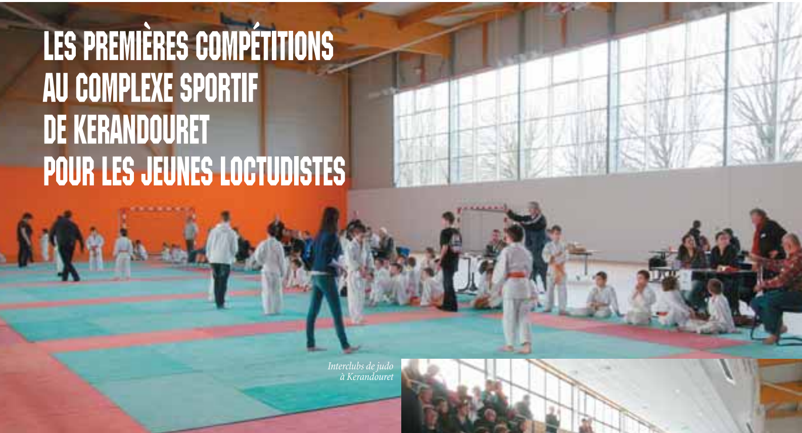
Interclubs de judo à Kerandouret

Depuis son ouverture mi-novembre, le Complexe sportif a accueilli de nombreuses compétitions pour des jeunes de toute la région dans de nombreuses compétitions. Nous avons choisi de vous présenter un éclairage particulier sur trois d'entre-elles.