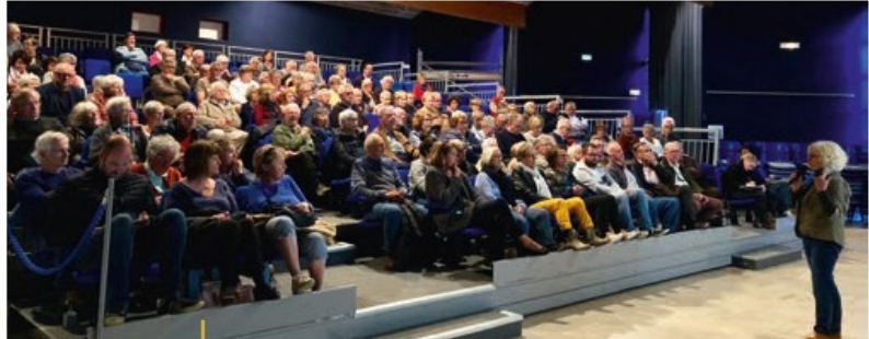
La réunion publique du 29 avril 2019 sur le PADD